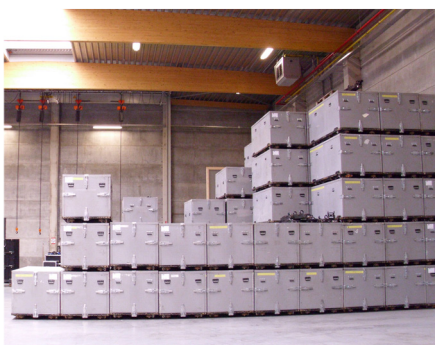
BOXY PRE LETECKÚ PREPRAVU