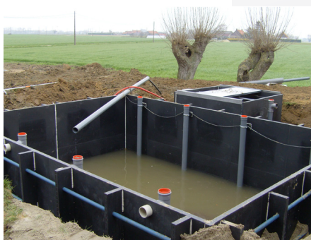
SPRACOVANIE SPLAŠKOVEJ VODY

Dosky Paneltim® pre konštrukciu nádrží na kvapaliny, nádrží na ryby, vodných zásobníkov, bazénov, kúpalísk, odlučovačov mastnoty atď.