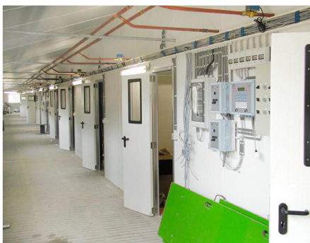
CHODBA S INTERIÉROVÝMI DVERAMI A OKNAMI

Dosky Paneltim® pre podlahy, steny, dvere, schodiská, obkladanie, prívesy, mobilné sanitárne jednotky, športové palubovky atď.