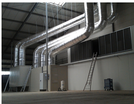
PRIEMYSELNÁ ČISTIČKA VZDUCHU