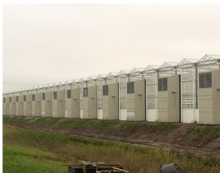
SYSTÉM REKUPERÁCIE TEPLA