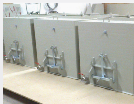
PREPRAVA ŽIVÝCH RÝB